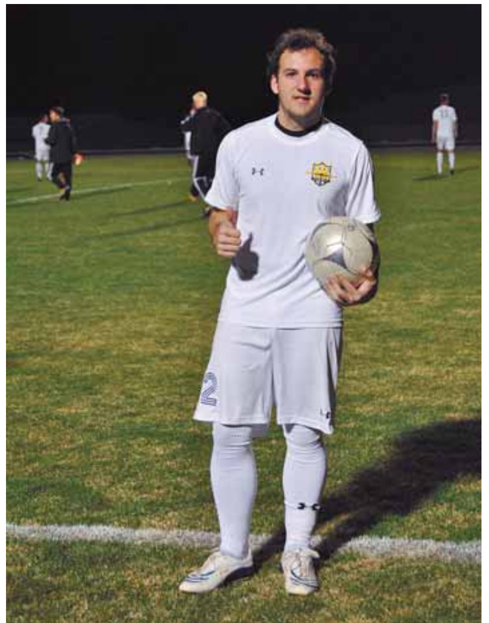
Equipo de fútbol Íñigo Rípodas Laquidáin con la equipación del equipo de su Universidad antes de un partido.

El pamplonés vive en la residencia del campus, en una habitación compartida, pero con baño propio. “En mi último año me gustaría irme a vivir con alguno de mis